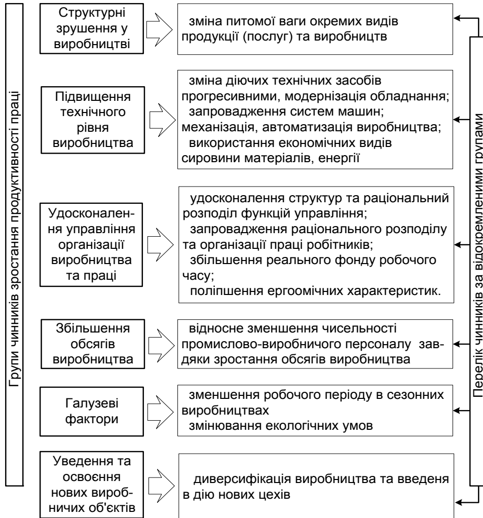
Рис. 2. Чинники зростання продуктивності праці на мікрорівні. Наведено за [8]

Серед макроекономічних факторів, які підлягали науковим дослідженням щодо впливу на продуктивність праці, відповідне місце займають макроекономічні пропорції. Макроекономічні пропорції, як показує міжнародний досвід, можуть бути виражені кількома показниками: питома вага валової доданої вартості високопродуктивних видів економічної діяльності у ВВП, питома вага зайнятих певної галузі у загальній кількості зайнятих, ефекти галузевих зрушень тощо. В зарубіжній літературі ефектом галузевих зрушень називається збільшення середньої продуктивності праці, яке з часом призводить до переміщення робочої сили і капіталу з галузей з нижчою продуктивністю в галузі з вищою продуктивністю під впливом економічних стимулів і політики. Ефект зміни галузевої структури відображає вище сукупне зростання продуктивності, обумовлене більшою часткою галузей з високим за своєю природою зростанням продуктивності. Важливо відзначити, що галузеві зрушення – не механічні процеси: їх швидкість і величина визначаються готовністю і